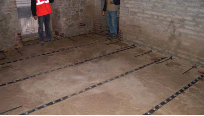
Solaio connesso e pulito