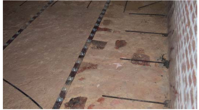
Connettori installati e la predisposizione di barre perimetrali per il collegamento con le murature