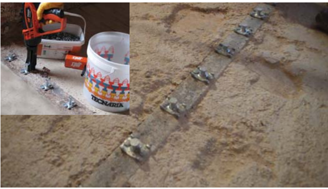
Applicazione di connettori di tipo Tecnaria CTF025