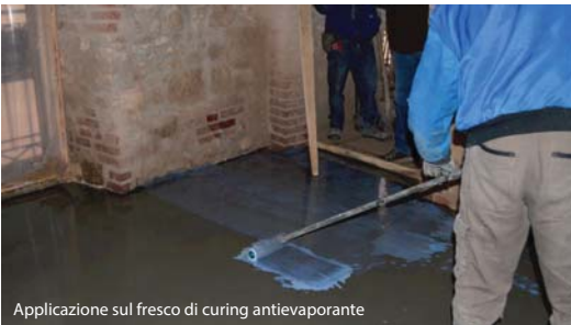
Applicazione sul fresco di curing antievaporante