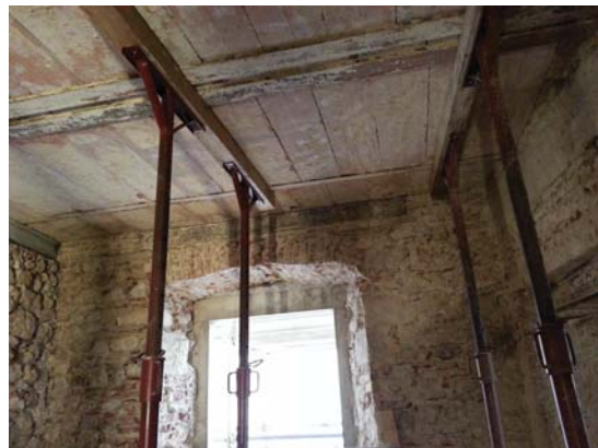
Puntellazione dei solai