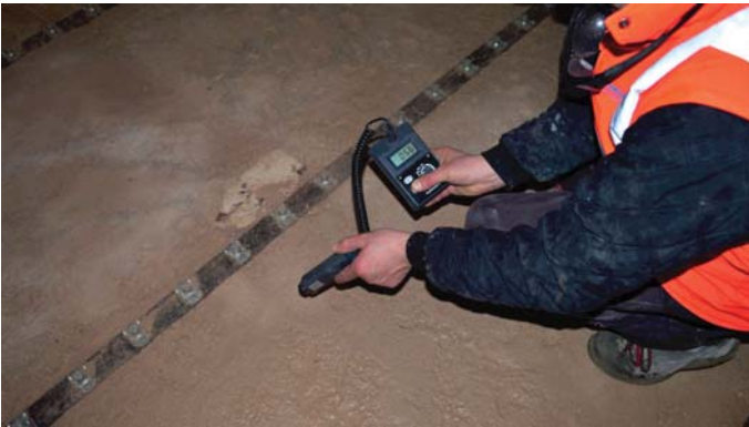
Misurazione umidità di superficie