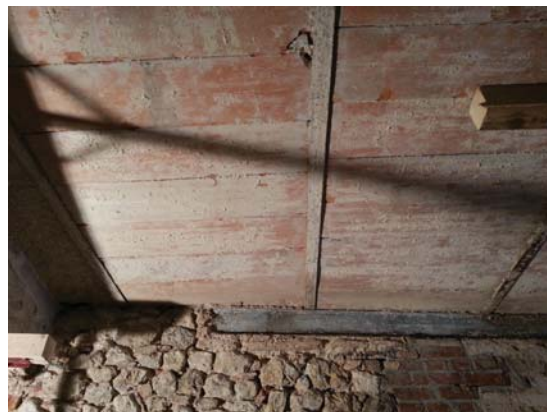
Vista dei solai da sotto