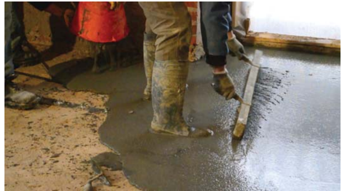
Posa mediante colata di 3 cm di Refor-tec® GF5 ST - HS