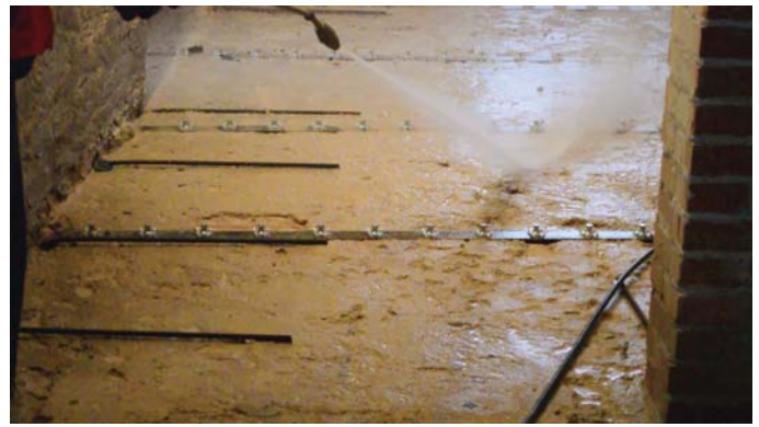
Lavaggio della superficie per la stesura della colata collaborante