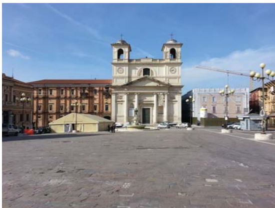
Il palazzo a fianco della Cattedrale di San Massimo

14 Maggio 2015 L' AQUILA – Il primo palazzo di Piazza Duomo viene reso alla città dopo i lavori di ricostruzione post sisma. L'edificio che affianca la cattedrale di San Massimo torna al suo splendore passato.