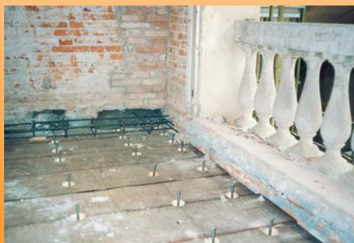
Per una maggiore completezza sono fatte delle riprese dei cordoli tramite gabbie e ferri inseriti nel muro portante.