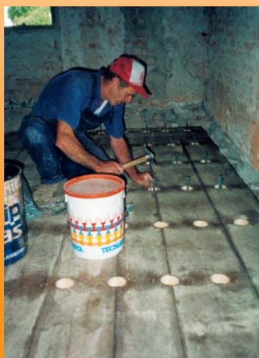
Il connettore è stato fissato tramite le due viti tirafondi alla trave portante con un avvitatore dotato di buona coppia.