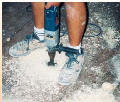
Si sono realizzati dei fori di diametro 65 mm sull'assito steso per mettere a nudo l'estradosso della trave in legno. Questa soluzione garantisce elevate rigidità alla connessione tra legno e calcestruzzo.