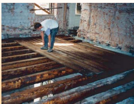
Dopo la posa delle nuove travi lignee negli alloggiamenti già esistenti è stato steso e chiodato l'assito soprastante.

A causa del degrado subito alla struttura, anche al suo interno, si è resa necessaria la sostituzione dei solai lignei esistenti con un nuovi solai che, per vincoli architettonici, dovevano necessariamente essere ricostruiti in legno. La necessità di adeguare i carichi alle attuali esigenze normative e la richiesta di ottenere una maggior rigidezza, sia per evitare danneggiamenti di pavimenti rigidi e lesioni delle tramezzature, sia per migliorare il comfort abitativo limitando le vibrazioni dovute al calpestio e il miglioramento dell'insonorizzazione ha indotto i progettisti ad adottare la soluzione di solai misti legno-calcestruzzo. Gli interventi di consolidamento devono poi risolvere il problema della barriera al fuoco tra i piani.