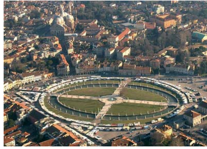
Vista dall'alto di Prato della Valle a Padova

Il Prato della Valle è la più grande piazza d'Italia ed una delle più grandi d'Europa con una superficie di 88620 m 2 . La configurazione attuale risale alla fine del XVIII secolo ed è caratterizzata da un'isola ellittica centrale, chiamata isola Memmia circondata da una canaletta sulle cui sponde si trova un doppio anello di statue. In periodo romano ed altomedievale l'area era nota come Campo di Marte o Campo Marzio perché destinata, tra le altre funzioni, a luogo di riunioni militari. Successivamente l'area fu indicata sia come "Valle del Mercato", per i mercati e le fiere stagionali che qui avevano sede, sia come "Prato di Santa Giustina" in relazione alla presenza dell'omonima chiesa. L'impostazione attuale è del 1775 sotto la supervisione di Andrea Memmo che immaginò di fare del Prato un luogo che potesse ospitare in maniera funzionale gli eventi fieristici storicamente qui localizzati, ma che negli altri momenti dell'anno fosse un luogo di ristoro e di passeggio per la popolazione.