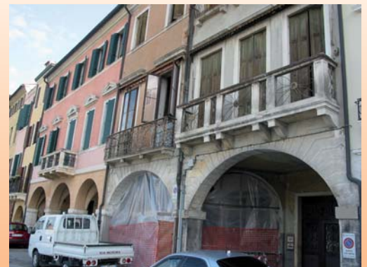
Vista esterna del cantiere e sotto l'affaccio su Prato