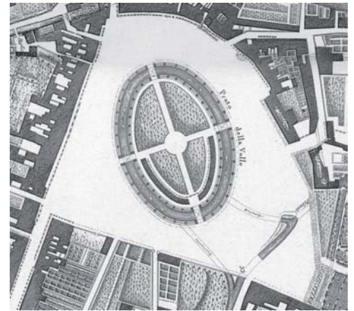
Planimetria di Prato della Valle - Particolare tratto dalla pianta di G. Valle (1784)

I solai di legno esistenti in un palazzetto affacciato sul famoso Prato della Valle andavano rinforzati con una soletta in calcestruzzo. Al fine di collegare la struttura portante di legno e farla collaborare alla gettata si sono utilizzati i connettori Tecnarìa MAXI fissandoli direttamente sopra l'assito previa stesura del telo traspirante idrorepellente 'Centuria'. L'operazione è stata molto semplice: rimozione del precedente massetto, stesura e fissaggio del telo traspirante, marcatura del passo di posizionamento dei connettori, perforatura di assito e trave ed infine fissaggio delle viti tirafondo date a corredo. Sono poi state stese le reti elettrosaldate e si sono fatti degli scansi sulle murature per inserire dei ferri nervati curvati che assicurino il collegamento della soletta orizzontale alle murature verticali. Prima della gettata collaborata è stata fatta la puntellazione dei solai.