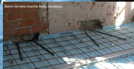
Barre nervate inserite nella muratura