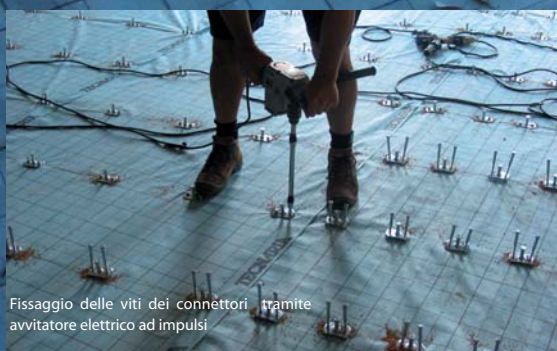
Fissaggio delle viti dei connettori tramite avvitatore elettrico ad impulsi