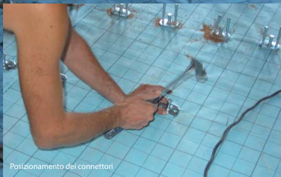
Posizionamento dei connettori