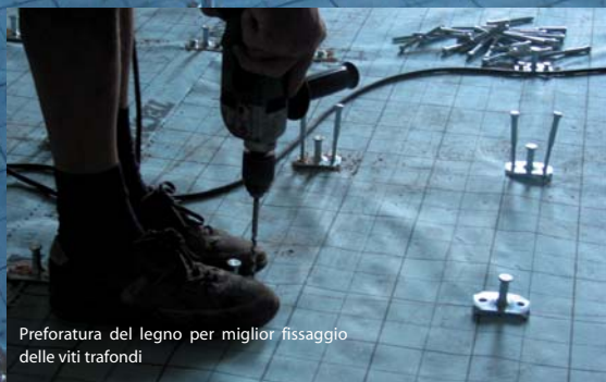
Preforatura del legno per miglior fissaggio delle viti traforati