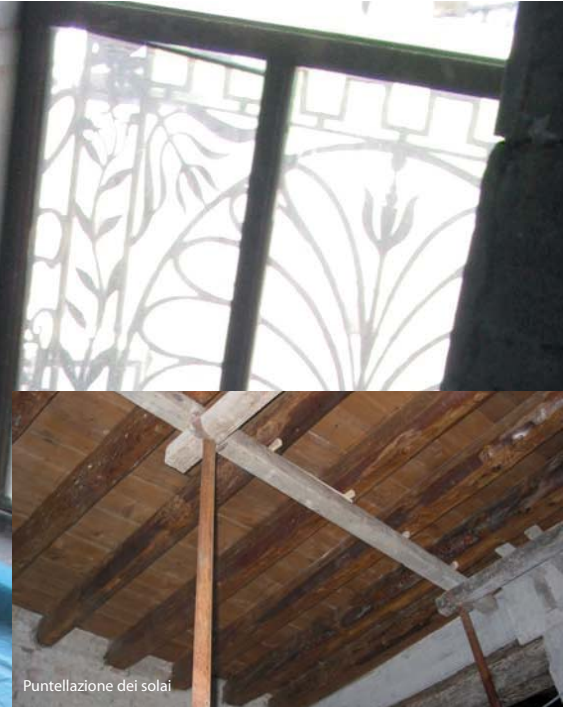
Puntellazione dei solai